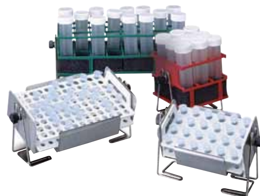
无金属丝的试管架夹具