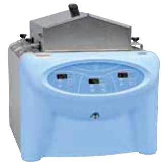
MaxQ 7000，带不锈钢三角形外盖 型号：SHK7000-30(见第 27 页的可选配件)