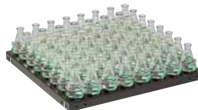
18 × 18", 50ml 锥形烧瓶平台 型号：3524-3