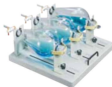
专用分液漏斗平台 型号：3524-49