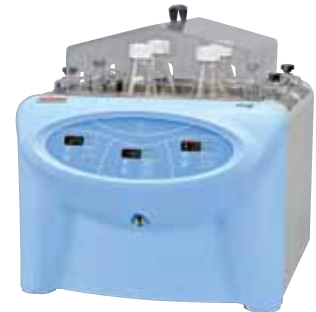
MaxQ 7000，带 Plexiglas® 三角形外盖 型号：SHK7000-32(见第 27 页的可选配件)