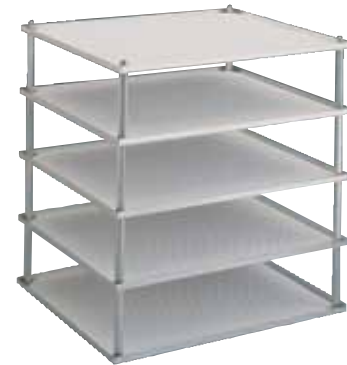
5 层血液袋搁放平台 型号：3523-51