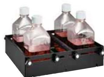
11 × 13" 可调容器平台 型号：3523-49