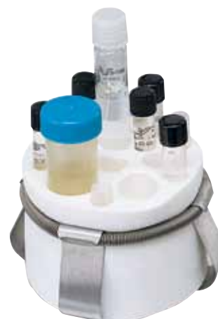
1L 烧瓶夹具的管瓶 / 试管插件

单层和双层摇床的架台用于搁放堆叠式摇床, 搁放高度应便于工作。堆叠成 3 层高的装置不需设该架台。