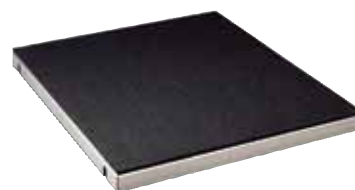
培养皿振荡台 型号：3523-46